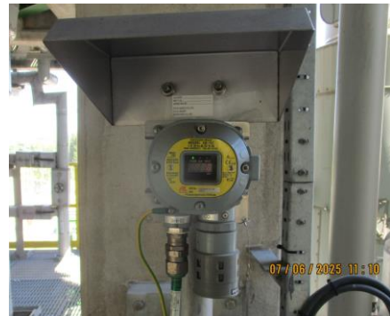
ภาพที่ 2-2 Gas Detector