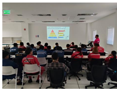
ภาพที่ 2-23 การอบรมเกี่ยวกับกฎระเบียบด้านความปลอดภัย อาชีวอนามัย และสิ่งแวดล้อม