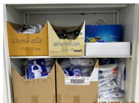
ภาพที่ 2-17 อุปกรณ์ป้องกัน PPE