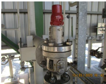
ภาพที่ 2-22 วาล์วฉูกเงิน (Automatic Isolation Valve)