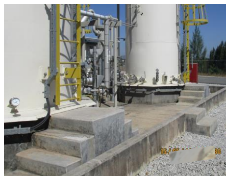
ภาพที่ 2-18 คันกันล้อรอบลานถังเก็บกาก