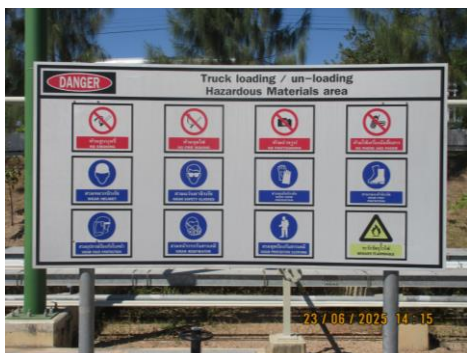
ภาพที่ 2-15 ป้ายเตือนให้สวมใส่อุปกรณ์ PPE