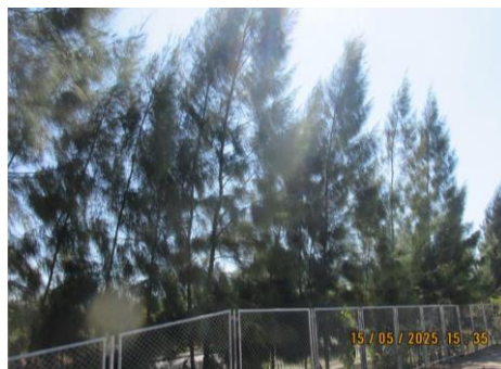
ภาพที่ 2-26 พื้นที่สีเขียวของโครงการ