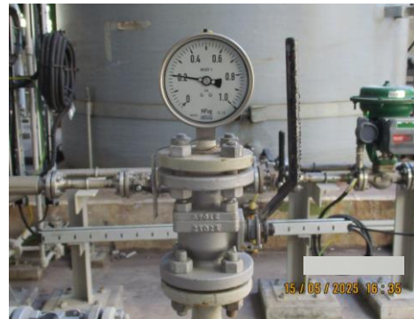
ภาพที่ 2-21 อุปกรณ์วัดอุณหภูมิและความดัน