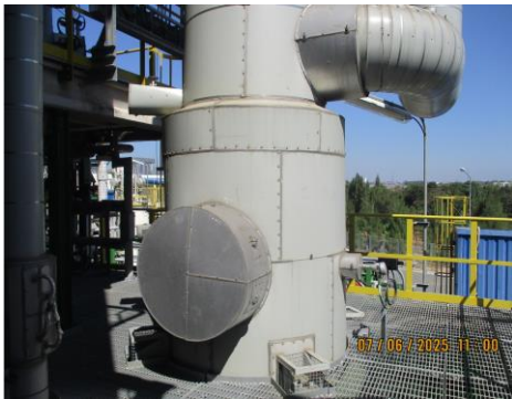
ภาพที่ 2-1 ระบบกำจัดฟอรัมดีไฮด์