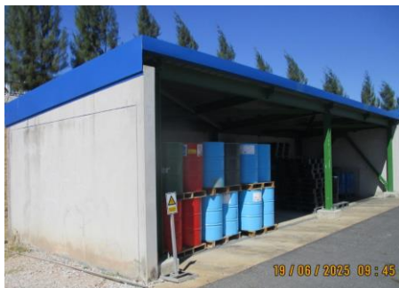
ภาพที่ 2-10 พื้นที่เก็บของเสียที่มีหลังคาปกคลุม