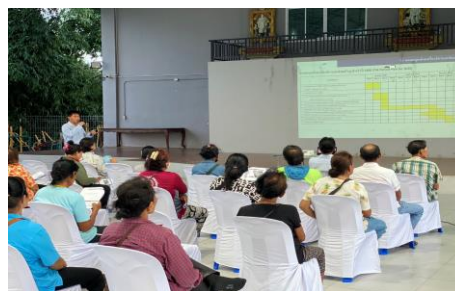
ภาพที่ 2-14 การประชาสัมพันธ์กับชุมชนใกล้เคียง