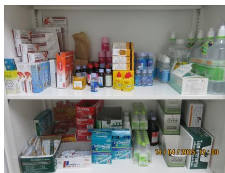
ภาพที่ 2-25 ห้องพยาบาลและเวชภัณฑ์พื้นฐาน