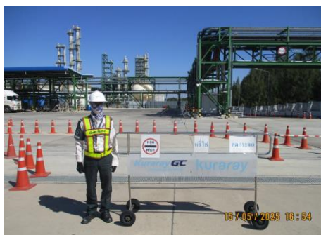
ภาพที่ 2-6 จุดตรวจบริเวณผ่านเข้า-ออกพื้นที่โครงการ