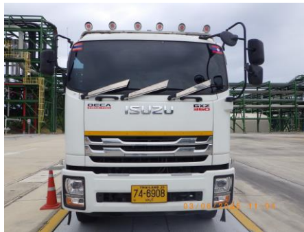
ภาพที่ 2-7 ติดเบอร์โทรศัพท์ ป้ายชื่อบริษัท รถขนส่งสารเคมี