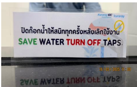
ภาพที่ 2-13 ประชาสัมพันธ์ประหยัดการใช้น้ำ