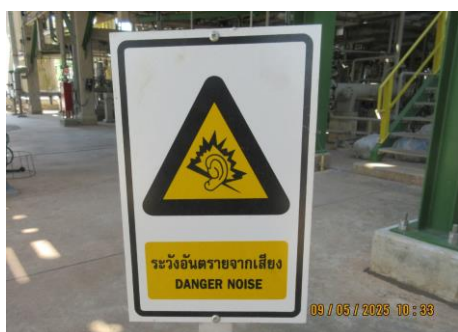
ภาพที่ 2-16 ป้ายเตือนพื้นที่ที่มีระดับเสียงเกินกว่า 85 เดซิเบลเอ