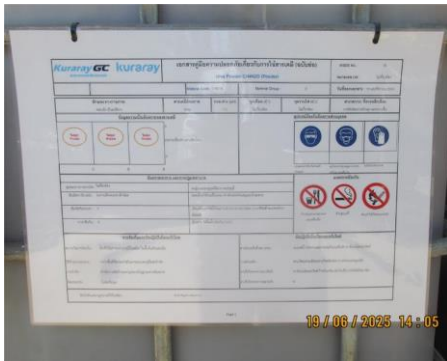
ภาพที่ 2-20 ข้อมูลความปลอดภัยเคมีภัณฑ์ (SDS)