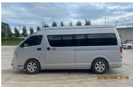
ภาพที่ 2-8 รถรับส่งพนักงาน