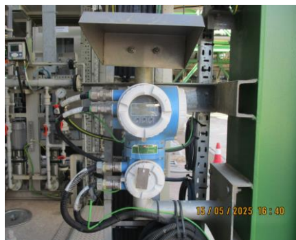
ภาพที่ 2-24 อุปกรณ์ตรวจวัดอัตราการไหล