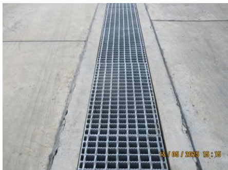
ภาพที่ 2-3 รางระบายน้ำ