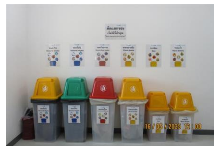
ภาพที่ 2-9 ถังรองรับขยะมูลฝอย