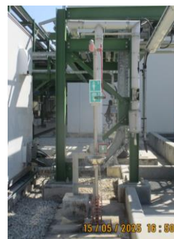
ภาพที่ 2-19 จุดชำระล้างร่างกายและล้างตาฉุกเฉิน