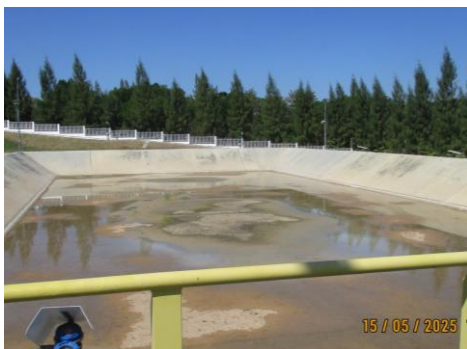
ภาพที่ 2-5 บ่อหน่วงน้ำฝน