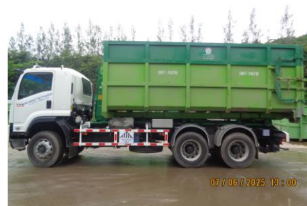
ภาพที่ 2-11 รถขนส่งกากของเสียอุตสาหกรรม