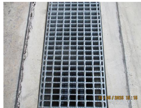
ภาพที่ 2-4 การทำความสะอาดรางระบายน้ำ